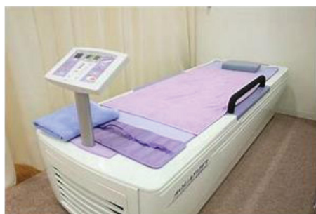
【ウォーターベット】